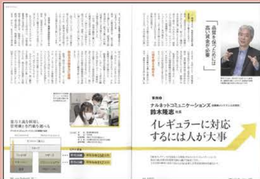
<雑誌掲載:『日経トップリーダー』>