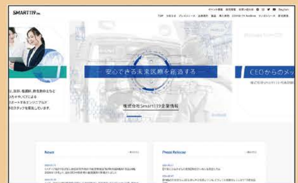
<コーポレーションサイト>